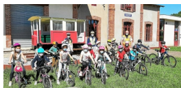
Les élèves de CP-CE1 de l'école Joliot-Curie, à vélo à la gare de Guiscriff