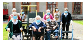
Tous les résidents de l'Ehpad "Au chêne", de Scaër, sont venus visiter le Musée de la gare

C'est dans le cadre de leurs études en seconde Animation - Enfance et Personnes Agées (AEP) du lycée Rosa-Parks de Rostrenen que 14 étudiants ont découvert le musée et l'escape game de la gare.