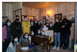
Des élèves du lycée Rosa Parks