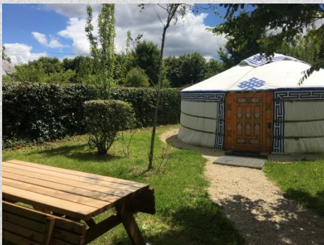
Une table de pique-nique a été installée à proximité de la yourte.